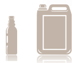
Botella de 944 cc y Garrafa de 5 l

Its presentation in different capacity formats adapts to all the necessities regarding the size of the task to undertake.