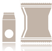
Bolsa de 700 gr y Saco de 20 kg