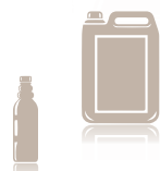
Botella de 944 cc y Garrafa de 5 l

Allows an effective control of efflorescence in products made of cement and concrete, like paving stones and blocks.