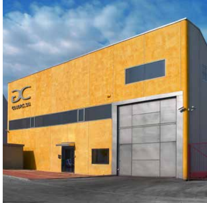
Nave principal de G&C COLORS en Ceuti (España). Cerramiento de placa de hormigón con cara vista texturizada y sellada con barniz acrílico base disolvente Lagytex

As a complement to our extensive range of pigments, and in accordance with the market requirements, we have developed a wide variety of ancillary products at G & C Colors.