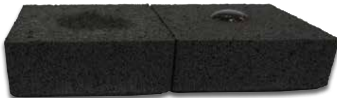
Test de hidrofugación a 15 minutos sobre piezas tratadas (d) y sin tratar (i)

This presentation of the additive, also in liquid form, is concentrated at 50%, which results in a greater water-repellent power with less quantity of product.